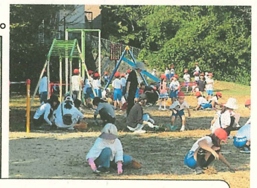
6年生が最後の片づけをしました。