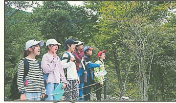
オリエンテーリング

と自然の中での活動を楽しみました。いつもと違う場所で、いつもと違う人と、いつもと違う活動を経験し、一回りも二回りも大きくなって戻ってきたようです。時間を意識し、友達と協力し合うことで、活動がスムーズに進み、予定になかったお楽しみの時間も味わえました。この経験を活かし、今からの学校生活で、「平和っ子のよさはこれだ！」というものを他学年にアピールしてください。