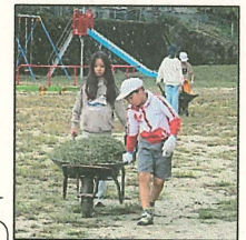
5年生が、草の片づけを手伝いました。