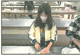
カレーライスづくり