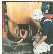
大仏の鼻の穴を通り抜けよう