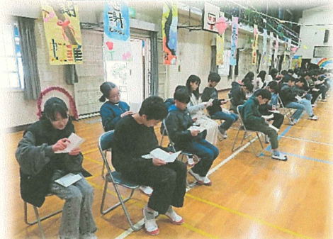
保護者からのお手紙を読みました