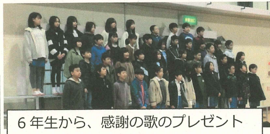
6年生から、感謝の歌のプレゼント