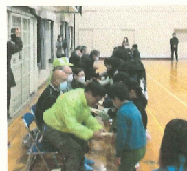
プレゼントを1年生から渡しました