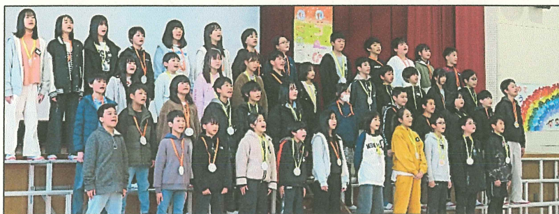
在校生からは「グッディグッバイ」 6 年生からは「あなたにありがとう」の合唱を