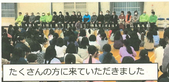
たくさんの方に来ていただきました

2月22日(木)、地域の方に感謝する会を、全校で開きました。4年ぶりに、やっと、直接感謝の気持ちを伝える機会がもてました。