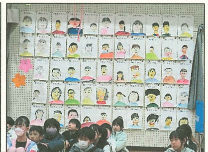
1 年生が書いた 6 年生の似顔絵