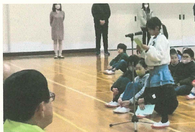
感謝のお手紙を読みました