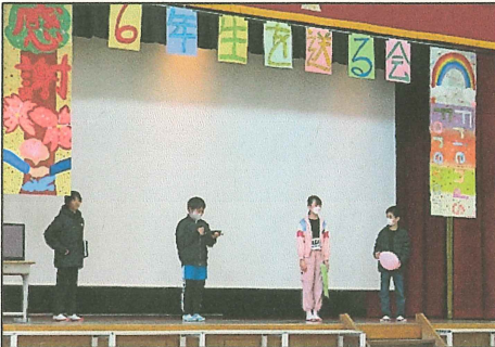
5 年生が企画したゲームを縦割りで・・・風船バレー