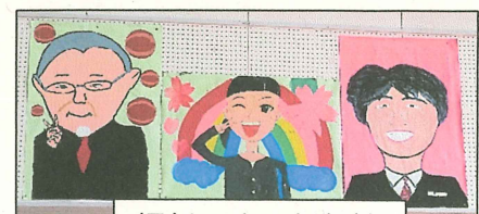
担任 3 人の似顔絵