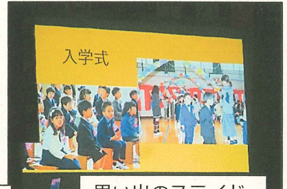
思い出のスライド