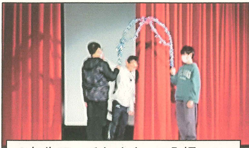
6 年生アーチをくぐって入場

いど ふりかえってせいちよう じっかん たてわりちーむ いっしょ げーむ たのし おたがい こころ こめたがっしょう おくりあつ かんしゃ ったえ イドで振り返って成長を実感したり、縦割りチームと一緒にゲームを楽しんだり、お互いに、 心を込めた合唱を送り合ったりして感謝を伝えました。