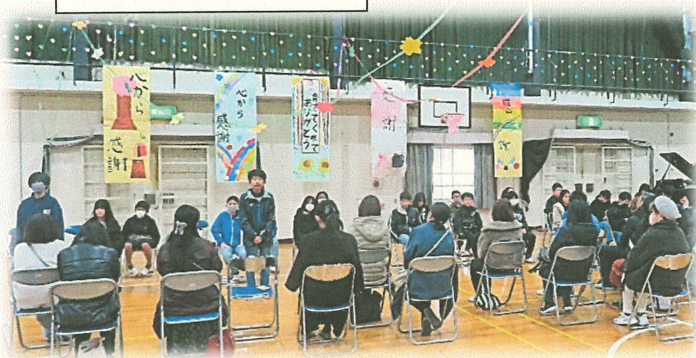
6年生 スピーチ「家族との思い出」