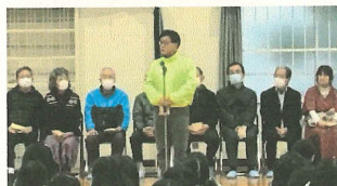
杉浦区長様から、「あいさつをしてくれるのがうれしいよ」とのお言葉をいただきました