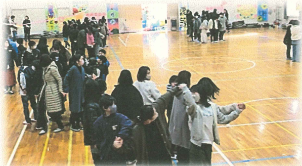
人間知恵の輪ゲーム

ささえられていきて かんじたじかん 支えられて生きてきたことをしっかりと感じた時間でした。