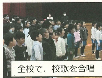
全校で、校歌を合唱