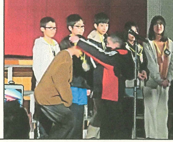
3 年生はメダルを渡しました